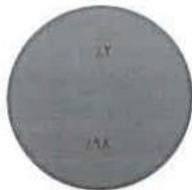
سه‌م ارزش بازار صنعت فاوا در بورس ایران